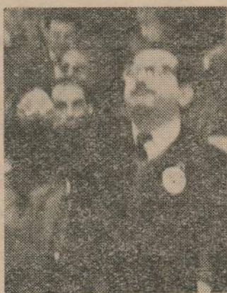
El representante de nuestra "Concentración" hablando en el Congreso Elector

Todo sucedió al revés. Desde el procedimiento para la elec-