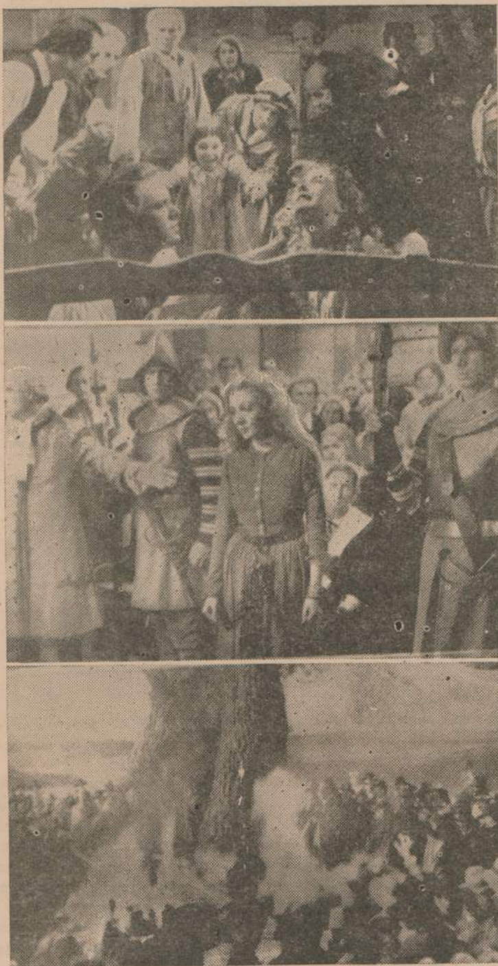
Tres escenas de "La doncella de Salem", que la Paramount estrenará el miércoles en el Ambassador

En una fiesta que da Wilfrid Lawson, un millonario enamorado de Constance Bennet, Loretta Young conoce a Tyrone Power Jr., joven conde que está próximo a contraer matrimonio con Virginia Field. Los dos jó-