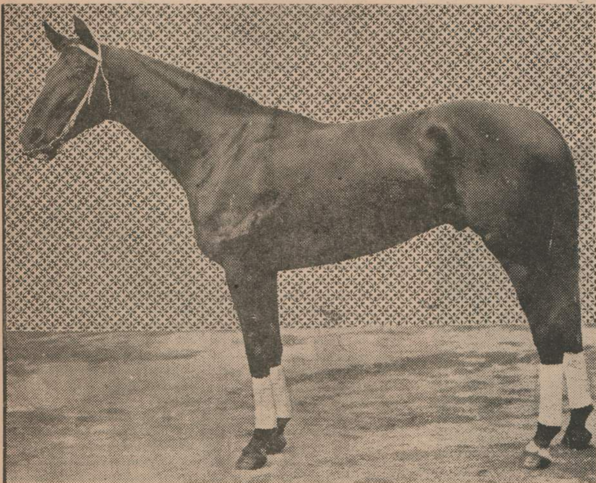
Radiant, el hijo de Royat, aparece como la faja del día