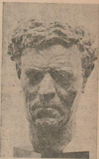
E. FABRI, DIBUJO ROSSI MAGLIANO

Un día al hombre le dió una congestión dentro del coche, como se hinchó mucho tuvieron que sacarlo con un escarbadien-