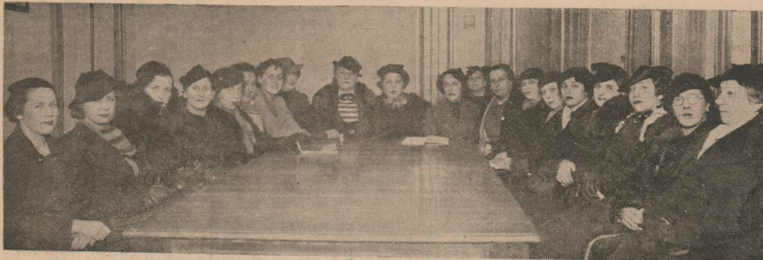
COMITE FEMENINO DE LA AGRUPACION POPULAR "DR. EDUARDO BLANCO ACEVEDO"

Esta agrupación invita por intermedio de nuestra página a todas las mujeres descendientes de militares a adherirse a ella y a colaborar en la inscripción femenina.