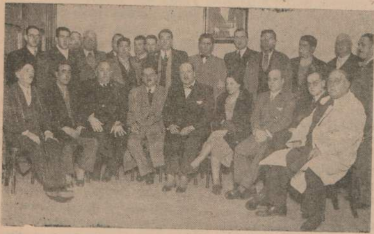
La Delegación de Mercedes y Dolores en la sede de la Agrupación Popular "Dr. E. Blanco Acevedo"