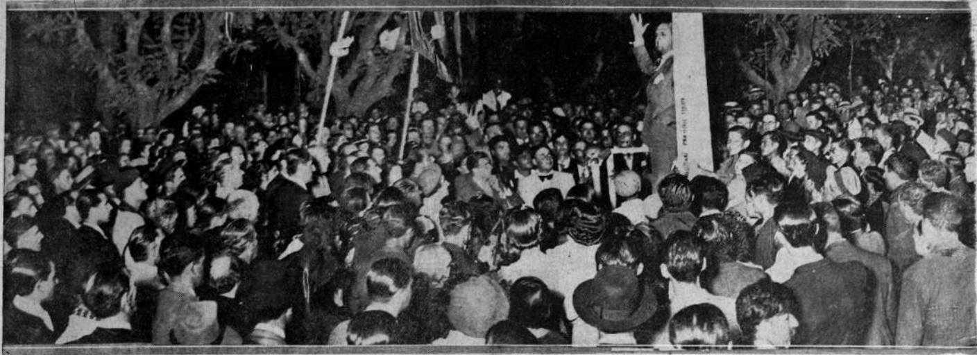
Una demostración de una importante asamblea donde está hablando el líder doctor Bado