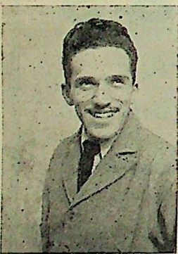
integrante del 'team' Campeón