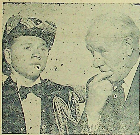
Lewis Stone y Mickey Rooney, (Juez Hardy y Andy Hardy—padre e hijo—) en