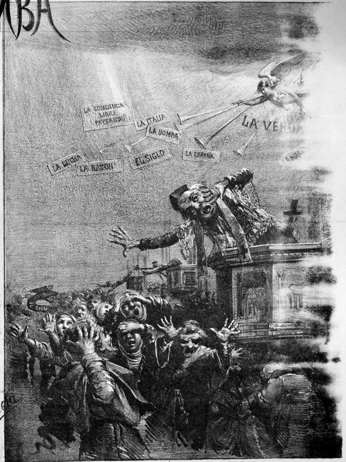
EFECTOS DE LA ÚLTIMA PASTORAL