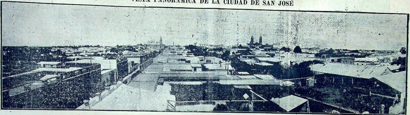
Hermosa fotografía de una parte de la capital maragata