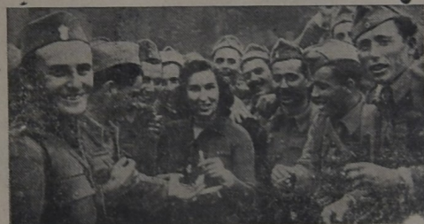
ESCENAS DE LA GUERRA.—La Secretaria de la Cruz Roja Británica distribuye cigarrillos entre los jóvenes y valientes soldados británicos evacuados de Grecia.

18 de Julio 1301 — Teléfono N.º 148 — Paysandú