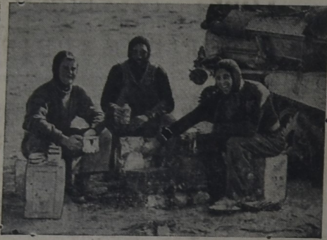
Valerosos Soldados patrulleros del Desierto, hacen un alto en el camino para atender sus respectivas raciones, sonrientes y optimistas.