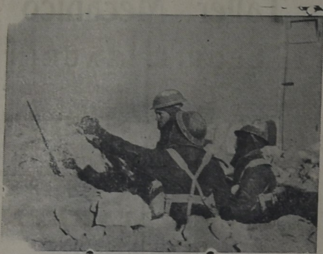
Avanzadas de las líneas inglesas en el sitio de Bagdad, pocos días antes de la caída de la citada plaza fuerte de El Irak.