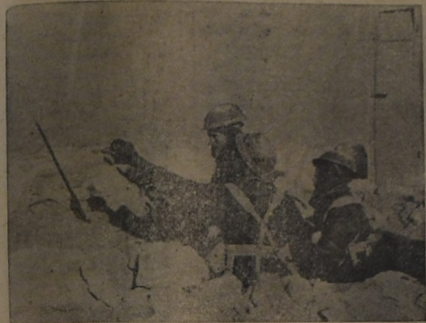
Soldados ingleses en un puesto de observación vigilan los movimientos de las tropas enemigas en Siria.