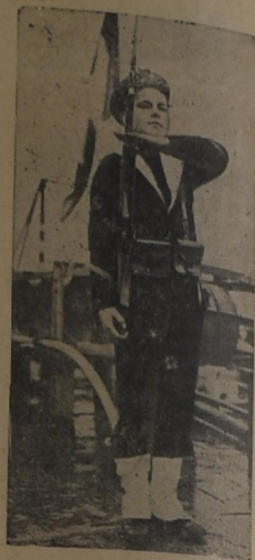
Un joven marino francés de la flota de Francia Libre, de guardia en uno de los muchos buques de guerra estacionados ahora en puertos británicos.

Estuardo Acevedo 1475. Montevideo DE FRANCIA LIBRE