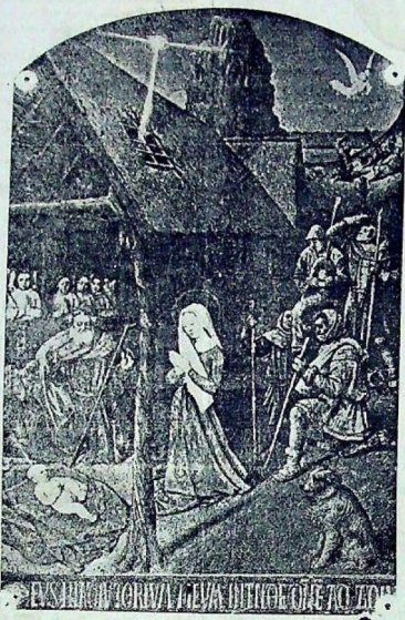
Cuadro de Fouquet

extraño que lo daba sudores y convulsiones. Jacobo I. de Inglaterra, no podía ver una espada desmenuada sin palidecer.