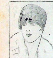
Tema de lamp negro adornada de una cintura de cinta de moaré con hebilla de plata.

te de hacer revivir, para la noche, la moda de los cabellos rizados y muchas señoras aceptan ya hebillas con entusiasmo.