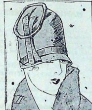
Sombrero de fieltro burdeos adornado y lornado de cinta gros grain del mismo tono.

La faja. —Sigue siendo el complemento del tailleur tanto como del traje de noche; pero se elige con discernimiento.