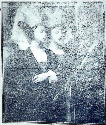
MARLENCE.—Canto de Navidad