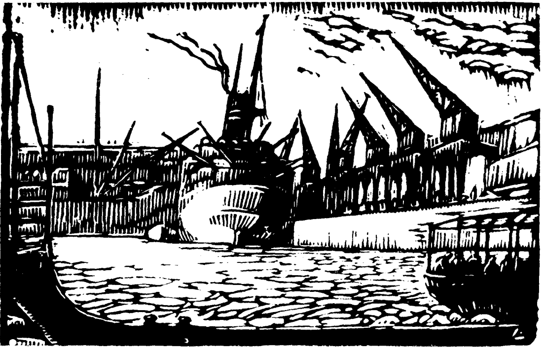
Rincón del puerto de Montevideo en la segunda década del siglo. Grabado de Landau.