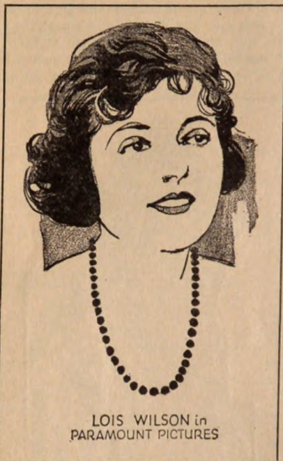
LOIS WILSON in PARAMOUNT PICTURES

Traducimos a continuación los detalles de más interés de las películas que serán estrenadas por la Paramount en Estados Unidos durante el mes de Diciembre del corriente año.