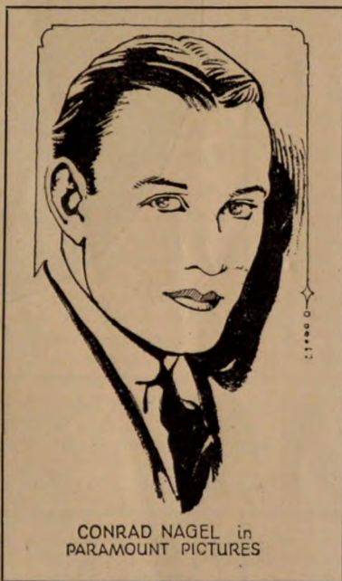
CONRAD NAGEL in PARAMOUNT PICTURES

Consecuencia de este malestar íntimo, el chauffeur se siente atraído por la que fué muchacha del lavadero, y el millonario empieza a entusiasmarse con la señorita elegante con quien estuvo en otrora comprometido.