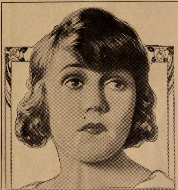
ALICE BRADY starring in Paramount Pictures

da de gitana. Temerosa de que sus compañeras de colegio se burlasen de ella si se enteraban, Betty adoptó un nombre supuesto. Sin embargo, algunas de sus compañeras la reconocieron y la felicitaron con tanto entusiasmo, que no pensó en cambiarse más el