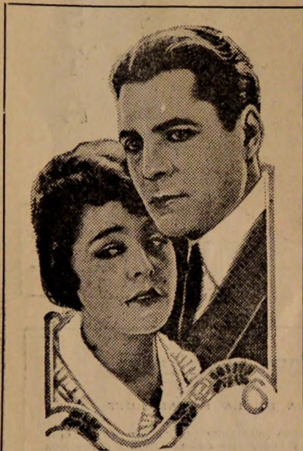
UNA PAREJA DE LA PARAMOUNT

Miss Negri interpretará el papel de mujer "vampiro" en la película "Bella donna", y, como corresponde a tales personajes, alterará su veleidoso amor con Conway Tearle, Claude King y Conrad Nagel, tres actores que contribuirán con su talento artístico a realzar la valiosa labor histriónica de la eminente y bella actriz polaca.