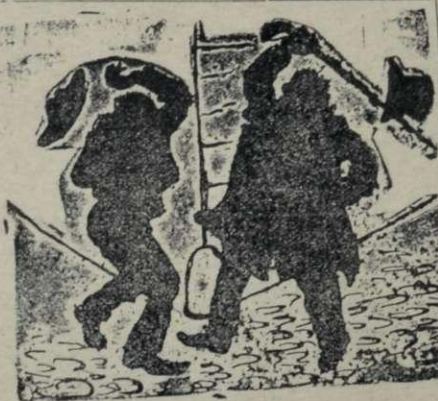
Cuestiones de periodistas; dejémoslos que se expliquen

—Sí . . . el papel en que iban envueltos, conjuntamente con este chichón que me hice en la frente, pues en la furia de la carrera di mi humilde persona contra un farol, en cuanto á los berrodos toda