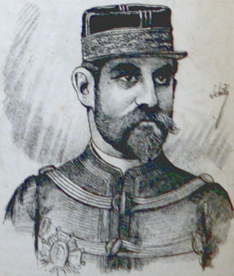
EL GENERAL BOULANGER † en Bruselas el 30 de Setiembre de 1891