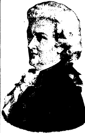
JUAN CRISOSTOMO WOLFGANG MOZART

Ruidosas aclamaciones, interminables aplausos y una calurosa ovación en que tomaban parte todas las clases, saludó constantemente al jóven compositor durante las representaciones de la mencionada