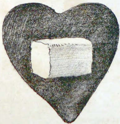
Del corazon de un ministro de Gobierno.