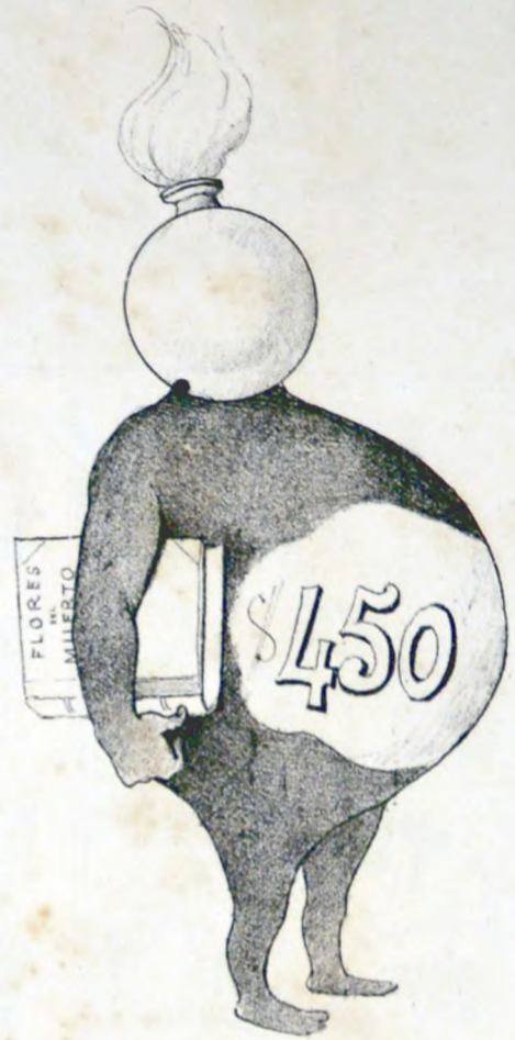
Del estómago de un diputado.