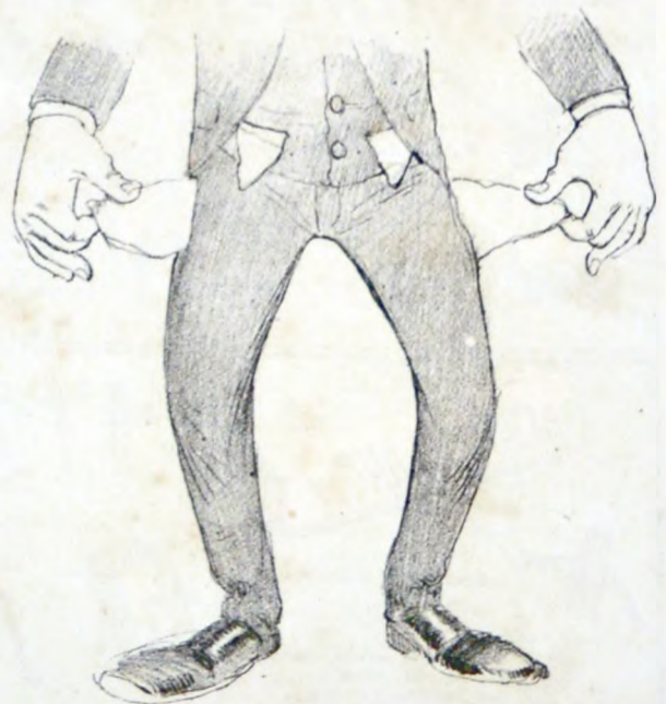
De los bolsillos del pueblo.