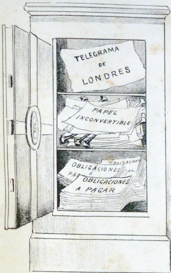
De la caja de la Nacion.

Mas interesantes que los de Buette y Dubois.