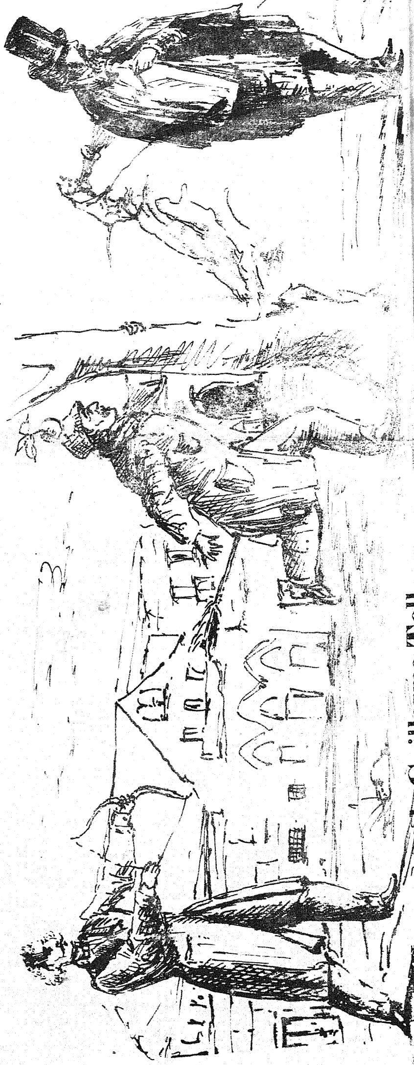
El ensayo de Guillermo Tell.

Un redactor leyendo un artículo editorial por intermediación de Zapiron.