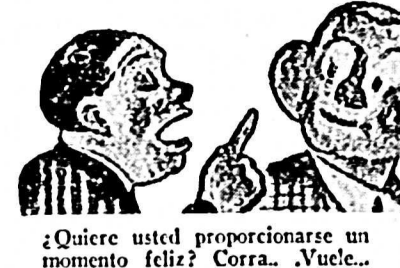
¿Quiere usted proporcionarse un momento feliz? Corra... ¡Vuelo...