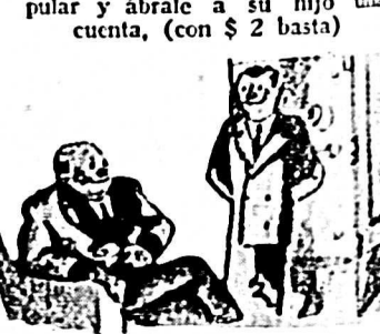
Y mañana cuando sea hombre de posición recordará que a su padre debe el hábito de la previsión y del ahorro

NIROS: El ahorro os formará un capital propio y éste os ayudará con el tiempo a defenderos en la lucha de la vida, solos, sin ayuda de nadie AHORRAD, AHORRAD y AHORRAD! y esto os ayudará a triunfar cuando lleguéis a hombres.