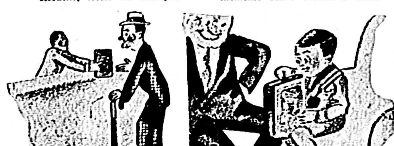
En el acto y completamente gratis le entregará una alcancía el Banco Popular