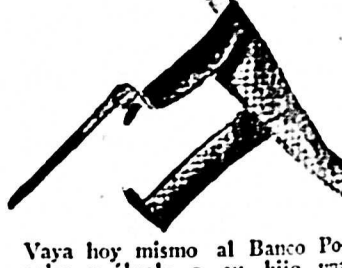
Vaya hoy mismo al Banco Popular y ábrale a su hijo una cuenta, (con $ 2 basta)