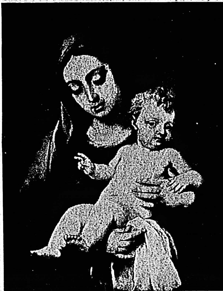
La Virgen con el niño, de Alfonso Cano