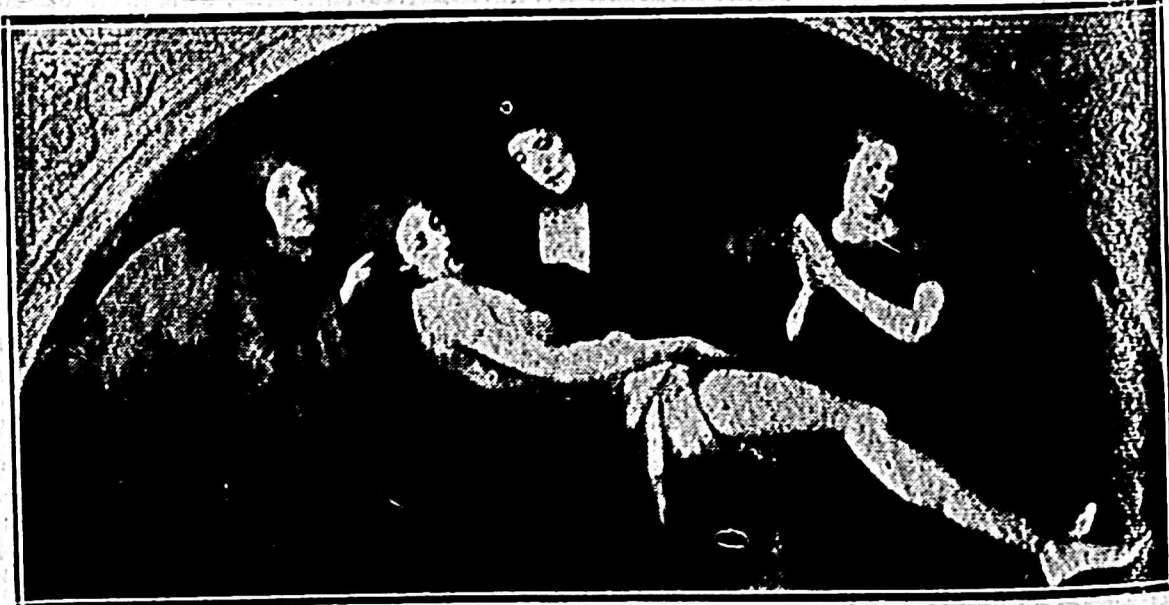
PIETA - por Francisco Francia