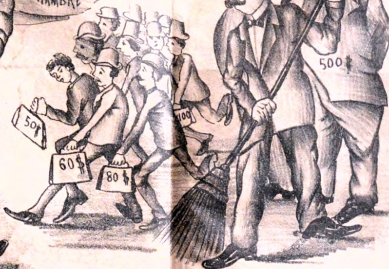
DESPUES DE UN AÑO Y MEDIO DE VIDA ARAGANA RECIEN EMPIESA EL BARRIDO POR LOS MAS FLACOS.