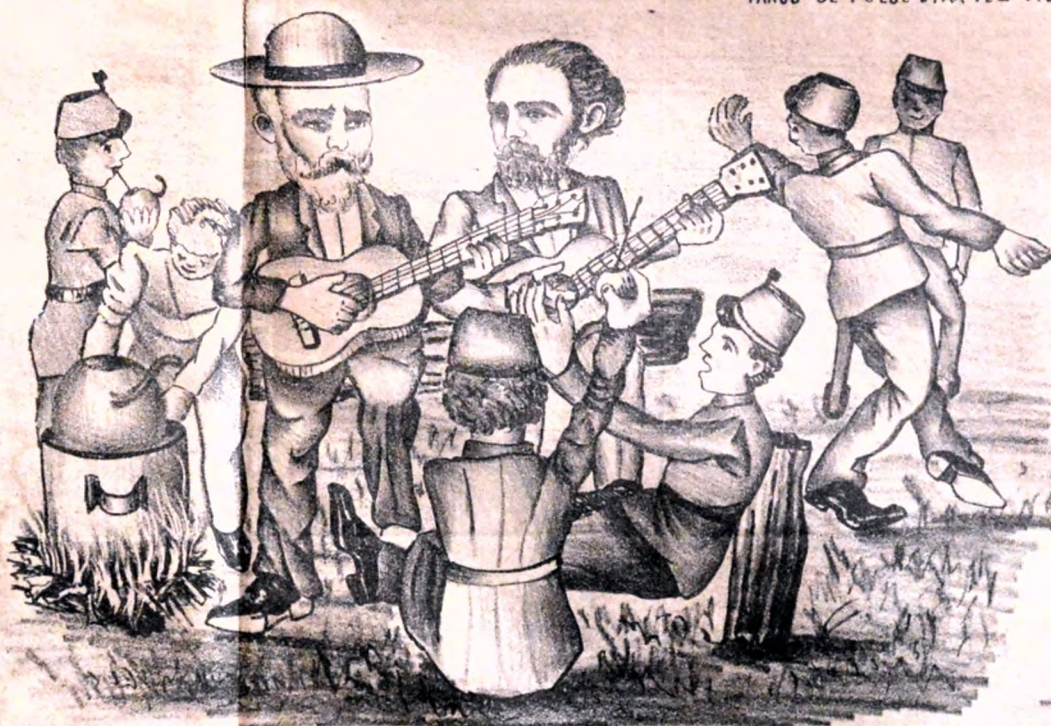
LOS MINISTROS VISITANDO EL CAMPO, NO DESCANSAN, SINÓ QUE TRABAJAN..... TOCANDO LA GUITARRA.