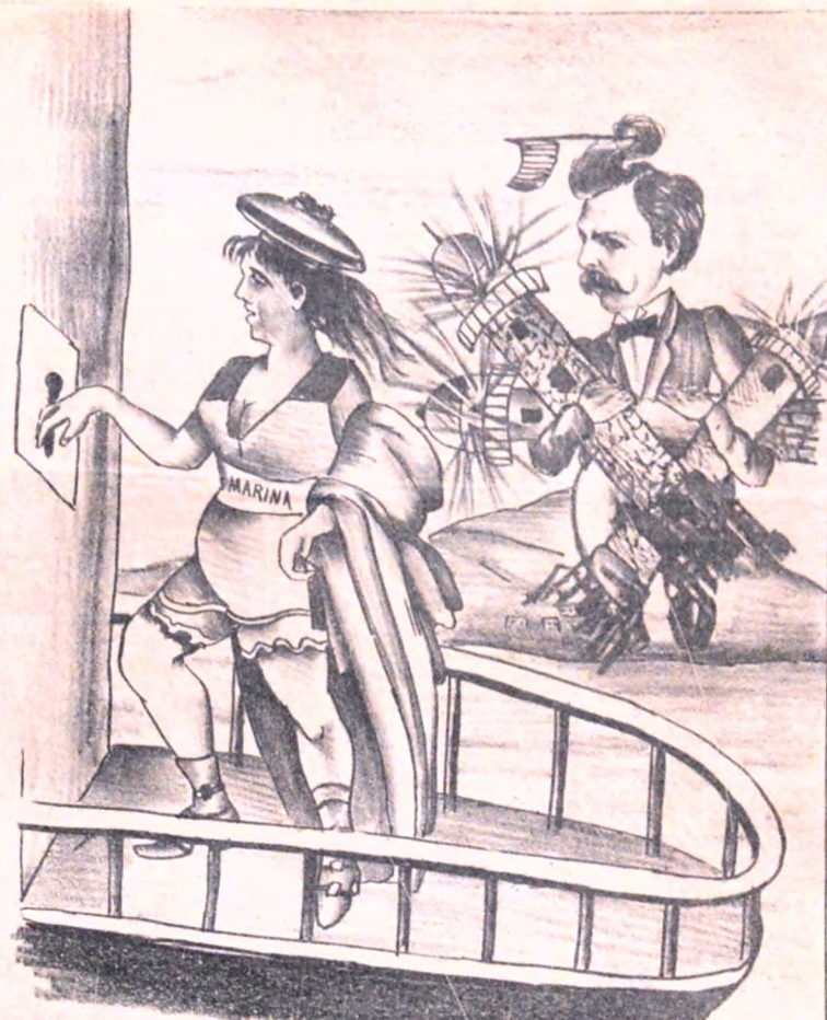
DISMINUYENDO LOS DERECHOS DE PUERTO Y DE FAROS SE PUEDE OTRA VES VISITAR A LA CIUDAD DE SAN FELIPE