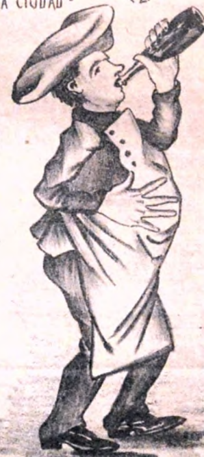
ES EL ÚNICO REMEDIO CONTRA LA CRISIS Y EL TRANCASO!