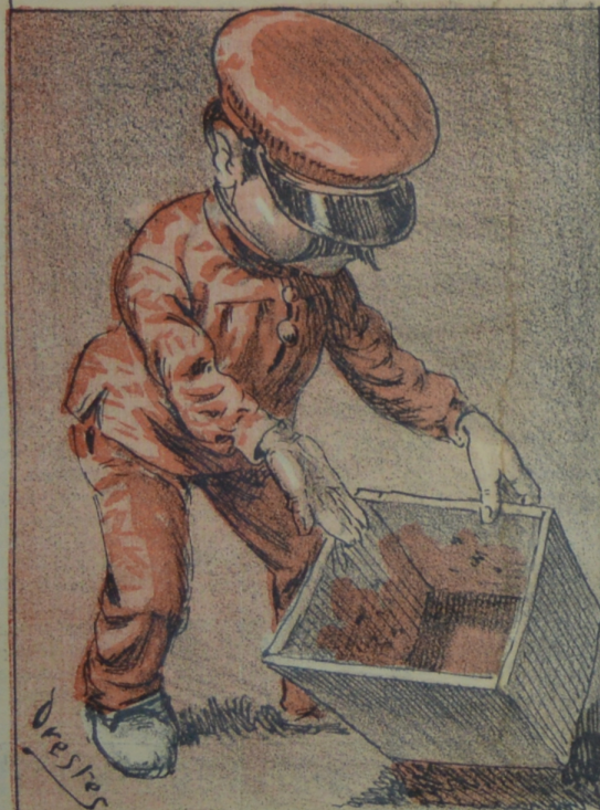
En la contienda con la Junta surta Muestra limpio el cajon al Señor Urta.