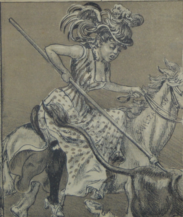
Mientras el Toro aqui hay quien lo quiere En Francia lo rechazan y se muere!!