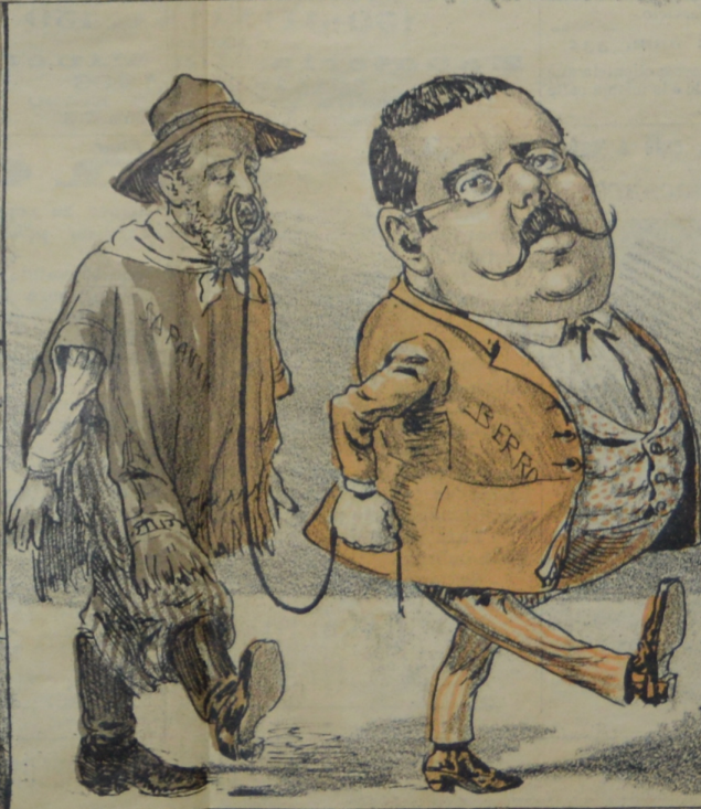
La autoridad del otro Presidente En el acordeones decadente