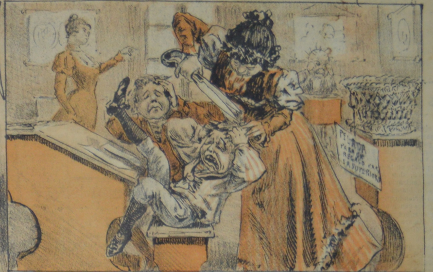
Ya se acabó la ferra en cada escuela, porque no se regala y no se pela.