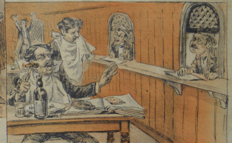
Si á algun le viene de comer la gana no se ponga empleado en la Aduana