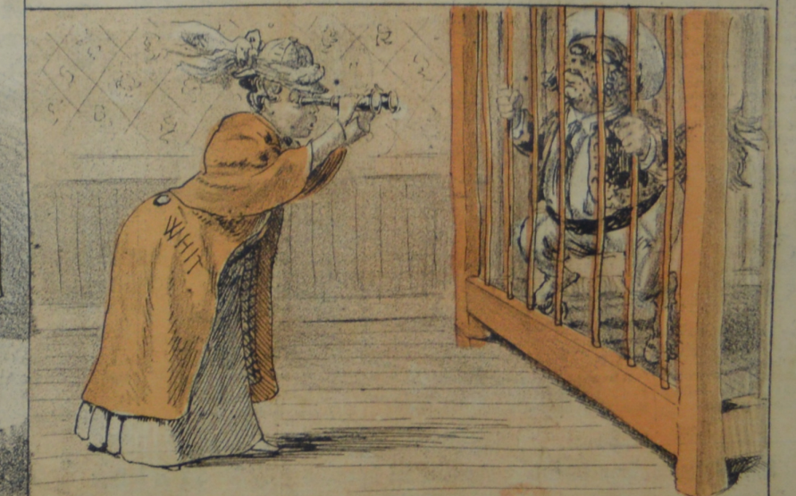
La americana Whit hoy se prepara á observar la enjaulada bestia rara.