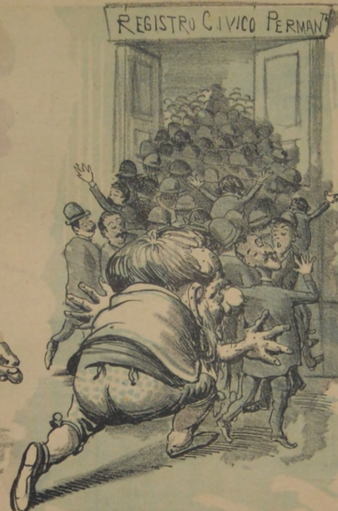
Empujones á todos suministro Si tardan á inscribirse en el registro.