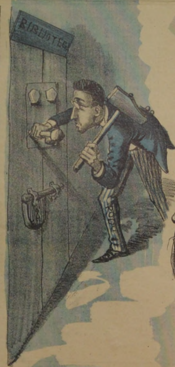
La puerta á Mas - garó Fué amarrada por Rodó