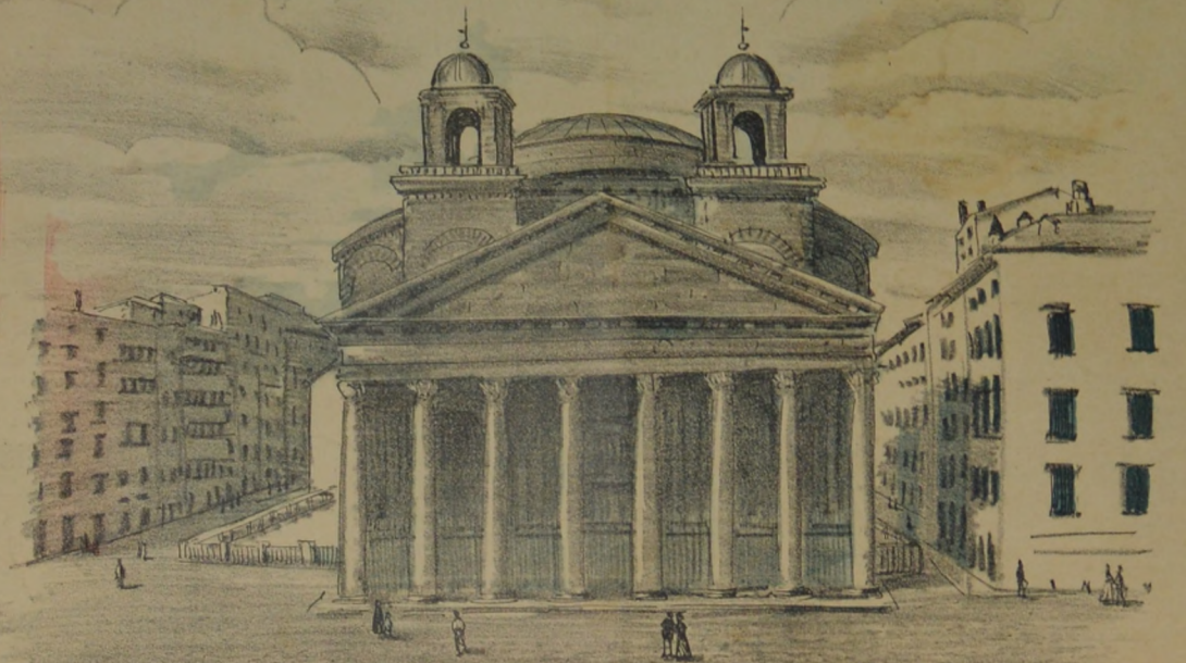
ROMA - VISTA DEL PANTEON - Donde serán guardados los restos de HUMBERTO I, REY DE ITALIA