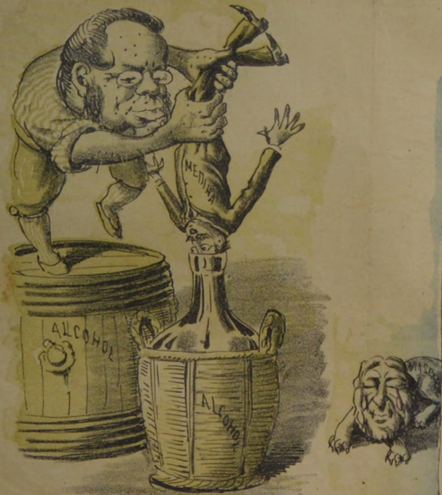
Propusieron á Medina por ministro en la gran China Ma luego, con idea sana, fué guardado en damajuana.