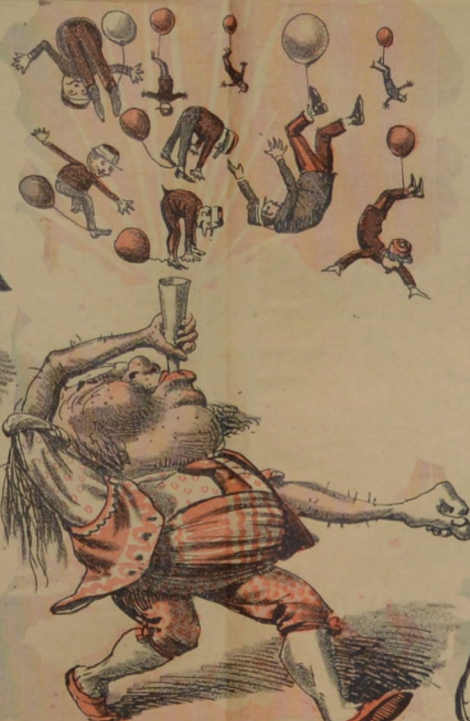
Se anunció la ascensión por Julio cuatro, Mas proximente se abrirá el teatro.