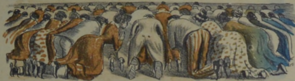
Durante el Te-deum se inauguró en la catedral, sin la presencia del Torero, una grande exposicion.