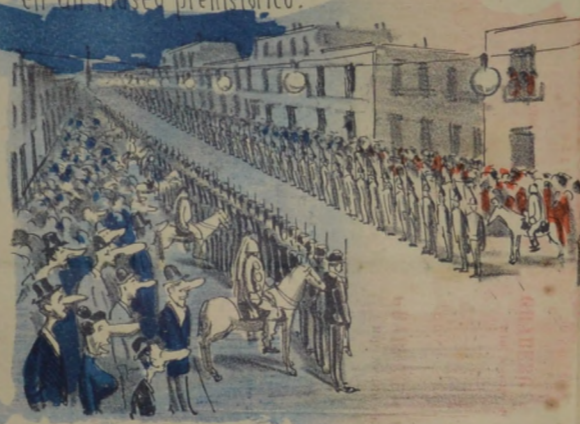
Por la calle 18 de Julio se esperaba el Presidente Torero que no apareció nunca