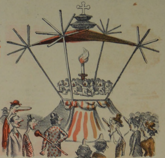
El chosco co-chinesco levantado en la plaza en 3 hora y 3/4 formó la admiracion universal.