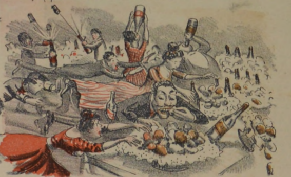
Mucha concurrencia asistió al buffet del Solís dando un formidable asalto á las masas.