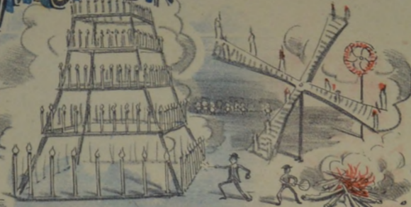
Los fuegos artificiales, antes del tiempo, confeccionados por grrrrandes pirotecnicos fueron dignos de figurar en un museo prehistorico.