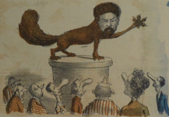
El sermón de SORILLA fué escuchado con las bocas abiertas.