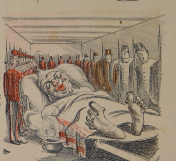
Al fin, despues de las fiestas, rodeado por los pretorianos, pudo dormir sueños tranquilos.