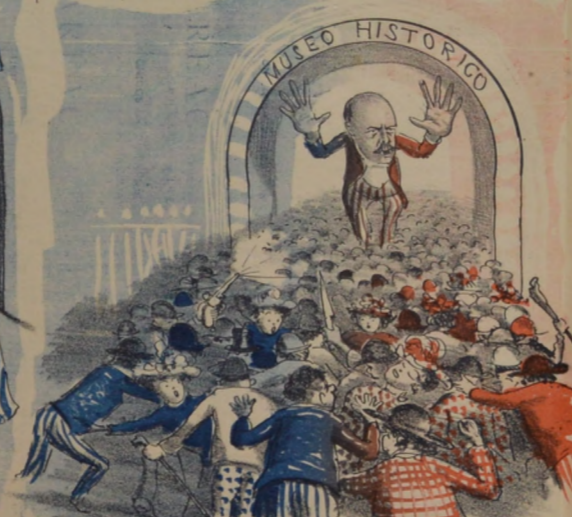
El museo historico fué por la concurrencia aficionada á la antigüedad, tomado por asalto