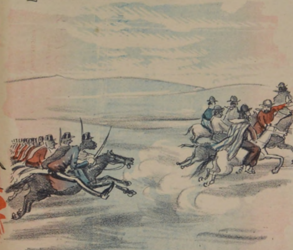
Arbitrariamente y sin respetar la ley fué educadamente disuelta la reunion en el Queguay