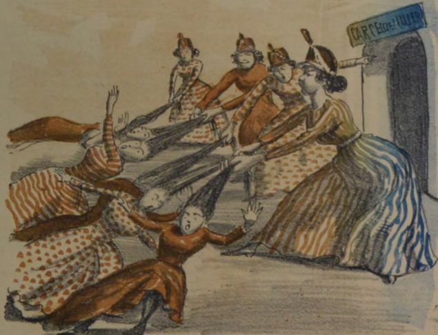
Uno de los hechos mas importantes, fué la colocacion de la piedra para carcel de mujeres