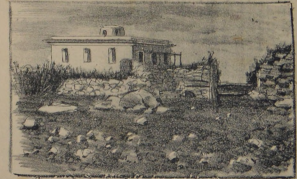
Casa de Garibaldi en Caprera.