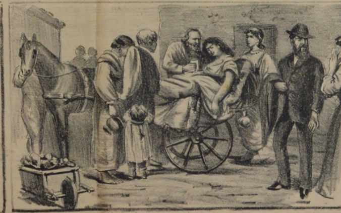
Muerte de Anita Garibaldi.