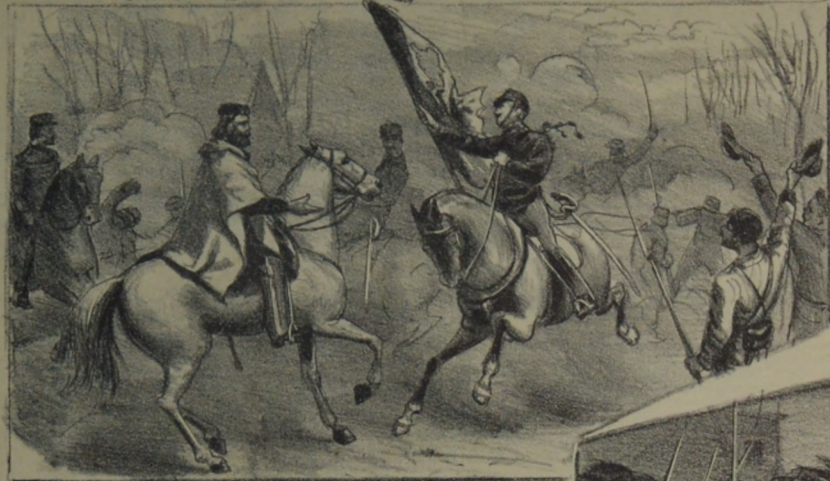
La campaña de Francia de 1870-Ricciotti entrega a Garibaldi la bandera arrancada a los Alemanes.