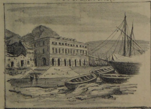
Casa donde nació José Garibaldi en Niza. Demolida en 1880