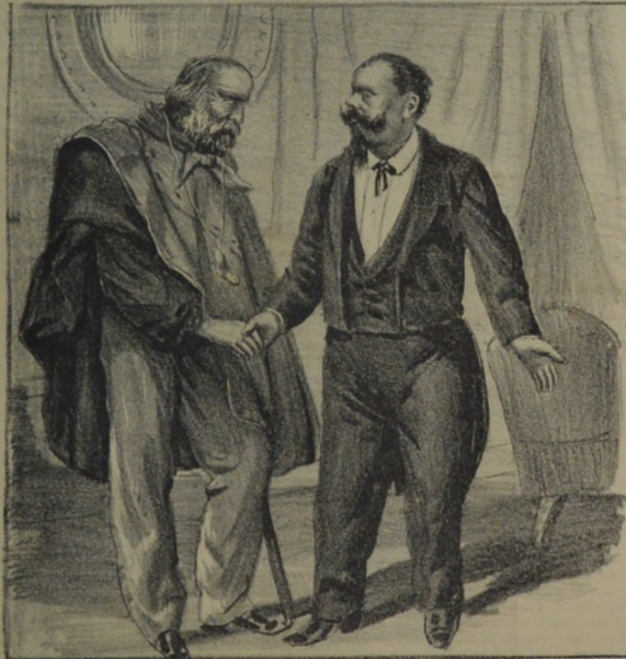
Garibaldi apretando la mano a Victorio Emanuel II en Roma el 30 de Enero de 1875