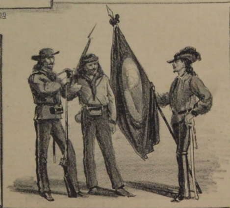
Soldados de la legión Italiana en Montevideo.