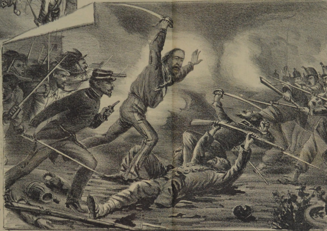
Garibaldi a la defensa de Roma la noche del 30 de Julio de 1846