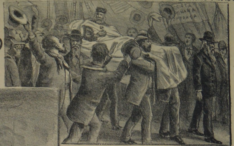
Una de las mil manifestaciones populares a Garibaldi