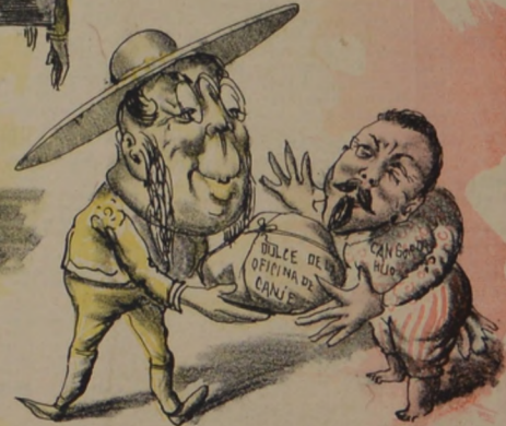
Como es el hijo querido de Cuestas y del Papá Todo dulce se ha comido y lo que se comerá!