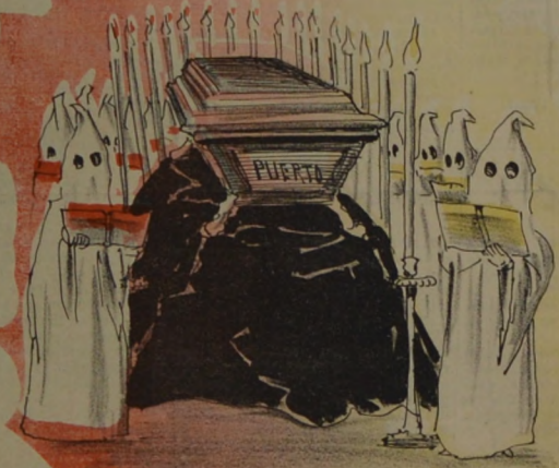
Gori gori! al pobre muerto... Así canta la canción Ya que vivió la Comisión que este puerto nació muerto.