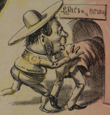
Aunque el palito se tuerza Rubio ha de entrar a la fuerza