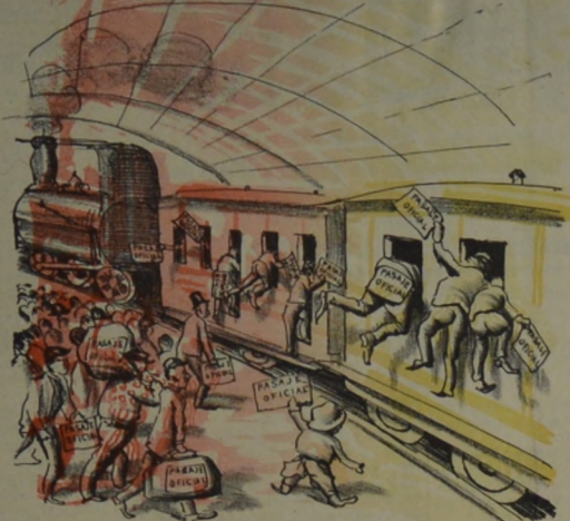
Nadie paga en este país, el no pagar es eterno. Y la gente del gobierno no paga el ferrocarril Manda Cuestas al infierno.