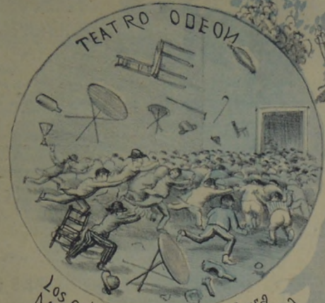
Los colectivistas con esa farra Margaron nueva gloria á la pizarrá