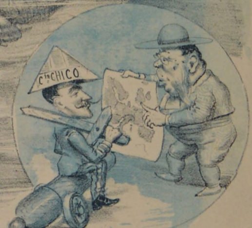
Despues de efectuado el casamiento De Ministro te daré un asiento.