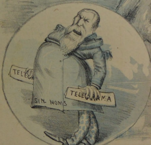
Es de poetica acuñacion el telegrama de D. Sin-Mon.