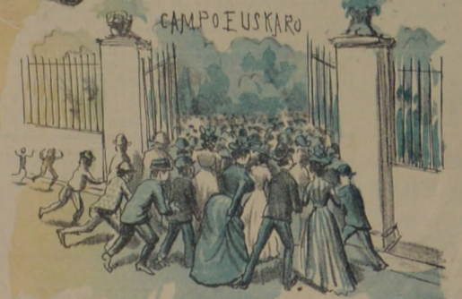
El mundo todo grita que no hay plata, Mas para diversion cualquier se mata.