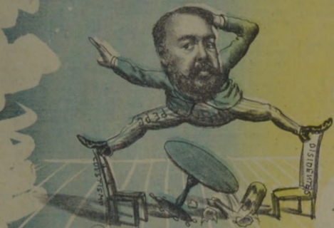
Equilibrista de fama, juntar los partidos trama.