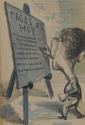
Día por día va los pagos apuntando Peró parece que no va pagando.