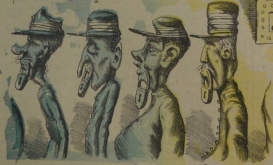
Al banquete colorado, el tata Dios del Torero Prohibió tomar bocado á cualquier hombre-guerrepeo