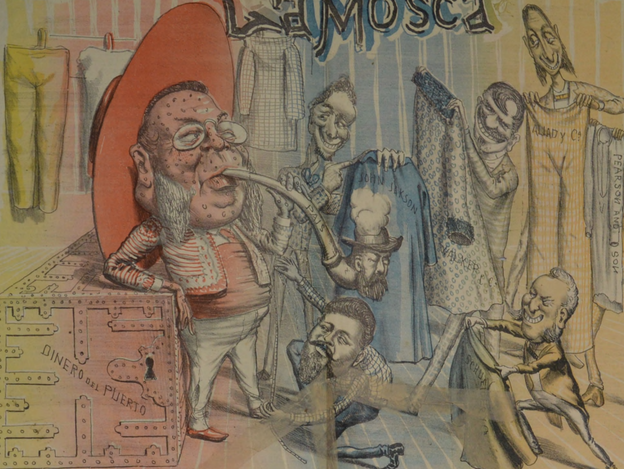
Con mucha exhibición y sin concierto se inauguró la sastrería del Puerto.

PROXIMAMENTE SE PUBLICARÁ EN "LA MOSCA" el folletín ilustrado de los acontecimientos DEL AÑO 1900