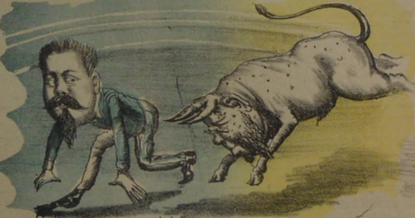
Falta poco y ¡zas! lo aborda el Torero al gran Cangorda