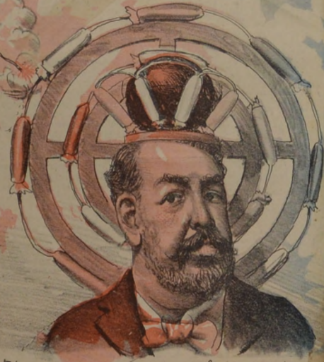
El gran censo colorado con fuegos pirotécnicos Por Pepe delegado se empezó el domingo á inaugurar