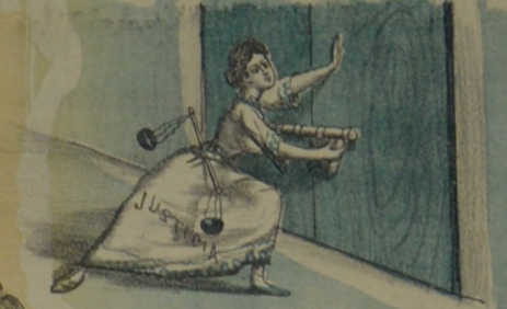
A empezar por la fiesta Natalicia Cerró su gran boliche la Justicia