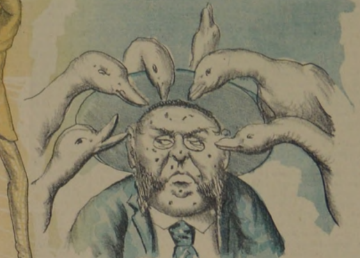
La cabeza del Torero cuidan todos con acierto, Porque hay algo de fuerza bajo el cabelludo cuero