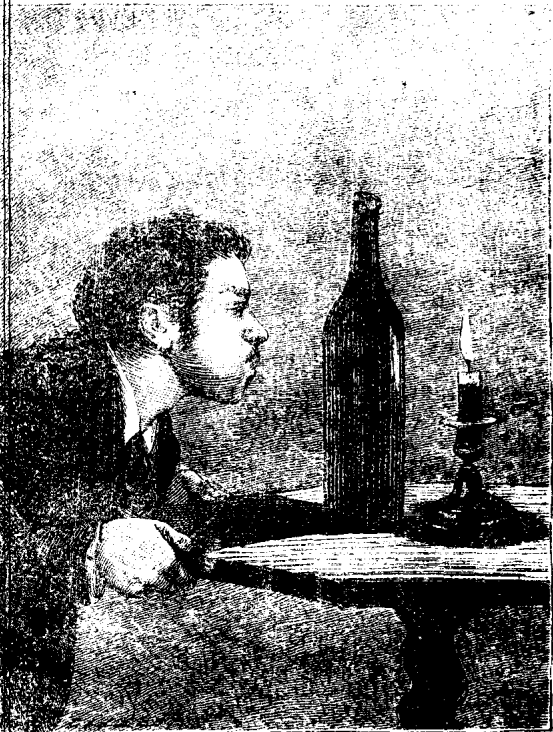
Modo de apagar la luz de una bujía habiendo delante una botella

ERRATA —En el artículo LA DOCTRINA DE CONFUCIO , donde dice 20 años léase 20 siglos.