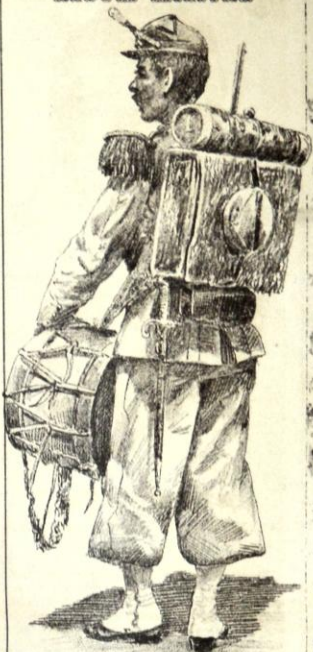
CAZADORES - TAMBOR, GALA CON TRAJE DE BRIN