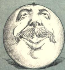
—¡Algo bueno prometía!