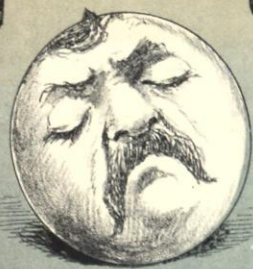
—Donde manda capitán no manda marinero.