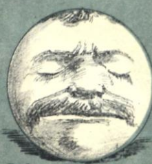
—En fin, con Borda y sin Borda todo pasó: «Y es bueno todo lo que conclye bien» como dijo Shakspeare.

En esa bola animada Se notan las impresiones De los varios sofocones Que le causa una jugada.