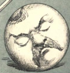
-Y eso de Baring.