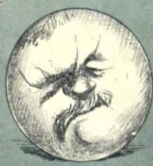
—Pero la maldita oposición de la Cámara.