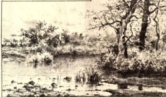
OTOÑO - Estudio del artista Hector Escardó

CON el TAPONAZO mas grande de los taponazos conocidos, quedó cerrada el Miércoles la discusión del asunto Baring, Obes y Ca.