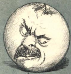
—Francamente, hubo momentos en que tuvo muy mal olor.