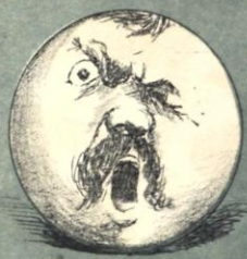
-Y el otro de Flores...