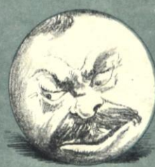
—Pero ese loco de Palomeque....