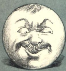
-Y lo que es Antónito no lo hizo mal.