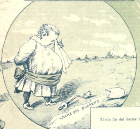
Triste fin del doctor Costa.