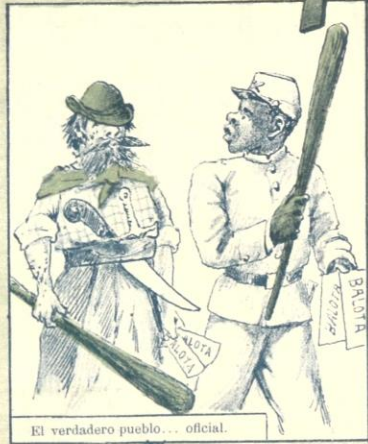
El verdadero pueblo... oficial.