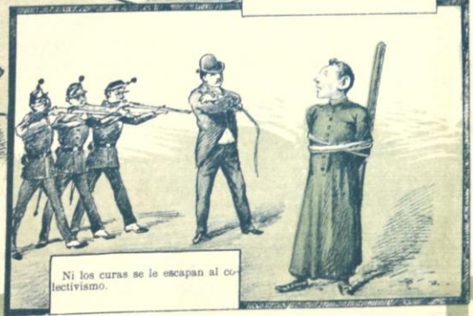
Ni los curas se le escapan al colectivismo.