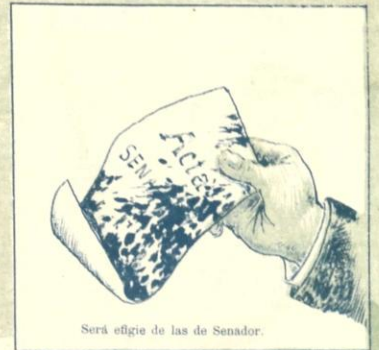
Será effigie de las de Senador.

¿Cómo me voy sosteniendo? Pues, así... como lo veís; y si no lo comprendéis, yo tampoco lo comprendo.