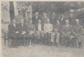
Integrantes del Comité de Ayuda a la URSS. de Colonia San Javier, que ocupa el primer puesto en la campaña por Insulina con $ 1,000.—

rró que ha entregado $ 515. El Comité Alemán Antifascista con $ 450.— hasta el momento, y las demás instituciones que figuran en el Cuadro de Honor Antifascista que publicamos en este número, sirvan de acicate a todo el resto de las organizaciones ayudistas, para multiplicar esfuerzos, superar cualquier clase de dificultad, y darlo todo, realizando sacrificios si fuera necesario, que nunca será bastante para lo que hacen los heroicos soldados aliados, por nuestra propia libertad.