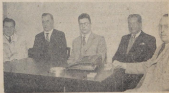
Delegación de la Asoc. Empleados y Obreros de la A. N. P. Div. Marítima, que concurren a Acción Antinazi a hacer entrega de la cantidad de $ 51.25 para Insulina, recaudados por medio de una colecta entre sus asociados y dirigentes con miembros de Acción Antinazi.

Pensemos que el soldado aliado que ha caído herido por la metralla asesina de las hordas germanas, el civil que agoniza por las torturas y vejámenes sufridos en manos de los bárbaros hitlerianos, vuelve sus ojos a nosotros y nos pregunta: