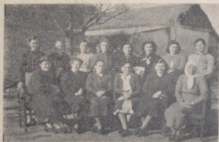
Integrantes de la Sección Femenina del Comité de Ayuda a la URSS, de Colonia San Javier, que ha prestado una gran colaboración al movimiento ayudista en la Campaña por Inulina.

Que con su lectura surja un sólo clamor en nuestro pueblo: AYUDA Y MAS AYUDA A LAS NACIONES ALIADAS!!