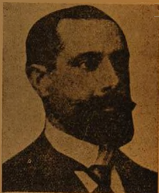
Sabino de Arana y Goiri, hombre de acción, ciencia y doctrina. Impulsó la nación baska hacia la reconquista de sus derechos

De ahí que el aspecto saliente de la historia de Euzkadi pueda resumirse en la lucha constante de un pueblo que defiende su libertad.