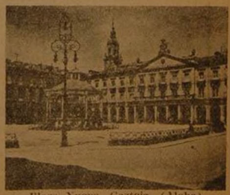
Plaza Nueva, Gasteiz, (Alaba)