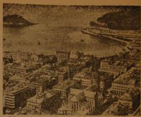
Visu panorami de S. Sebastián (Gulp.)