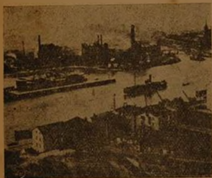
Los altos hornos (Bilbao)