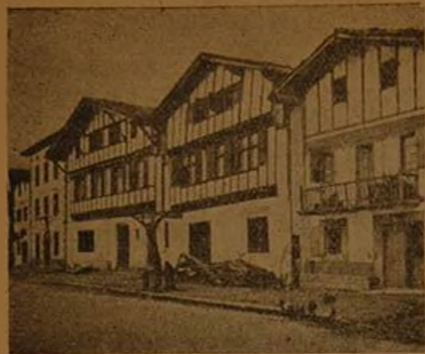
Casas típicas en Ainhoa (Laburdi)