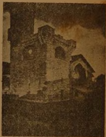
San Nicolás, Pamplona, (Nabarra).