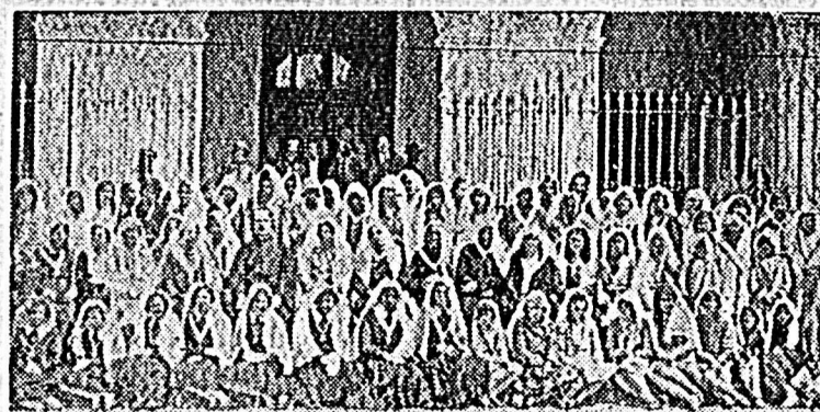
Congregación de las Hijas de María