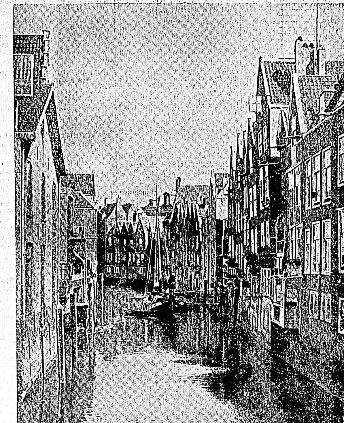
Canal en la ciudad de Dardrecht, fundada por los romanos en unode los parajes del Rhin inferior y que actualmente es un exponente del "comercio acuático" del reino de Holanda.