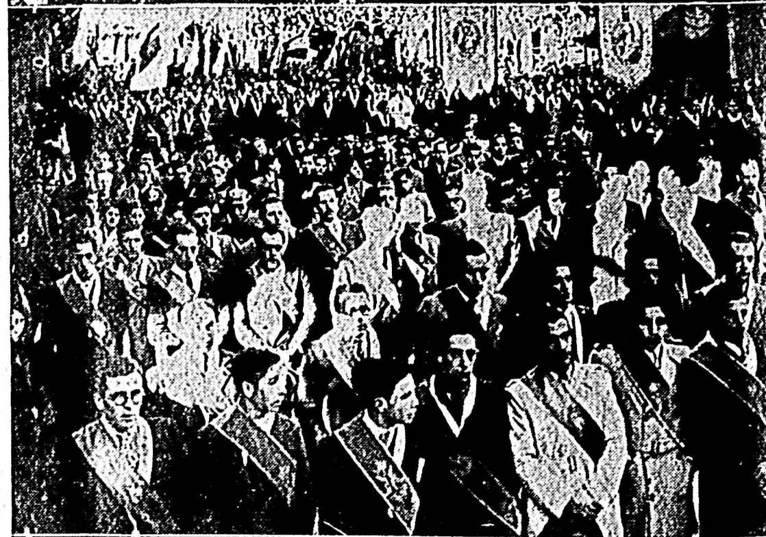
(Arriba) — EL SANTISIMO BAJO EL PALIO. — Al paso del Señor, que es luz, verdad y vida; los espíritus bien puestos sintieron palpitar sus corazones en la emoción dulcísima de la divinidad. — (Abajo): HOMBRES CATOLICOS. — Los hombres católicos, con sus insignias, mostraron en la gravedad varonil de su porte, una fé serena dispuesta a triunfar en una acción perseverante por el Bien y la Verdad sociales.