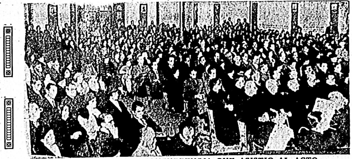
PARTE DE LA CONCURRENCIA QUE ASISTIO AL ACTO