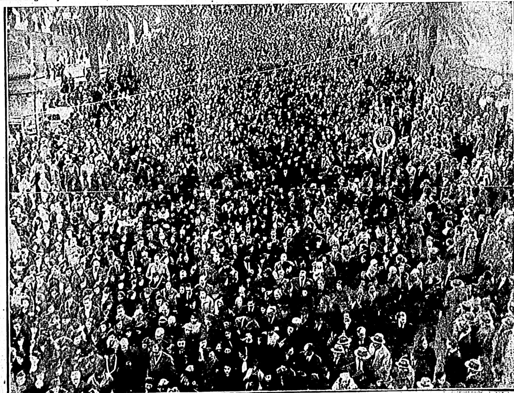
IMPONENTE ASPECTO DE LA PROCESION DE CORPUS

Este nuevo triunfo de los católicos uruguayos, reconocido por la prensa de las distintas tendencias, reafirma el honor del laicado y predica la victoria del Rey de la Gloria.