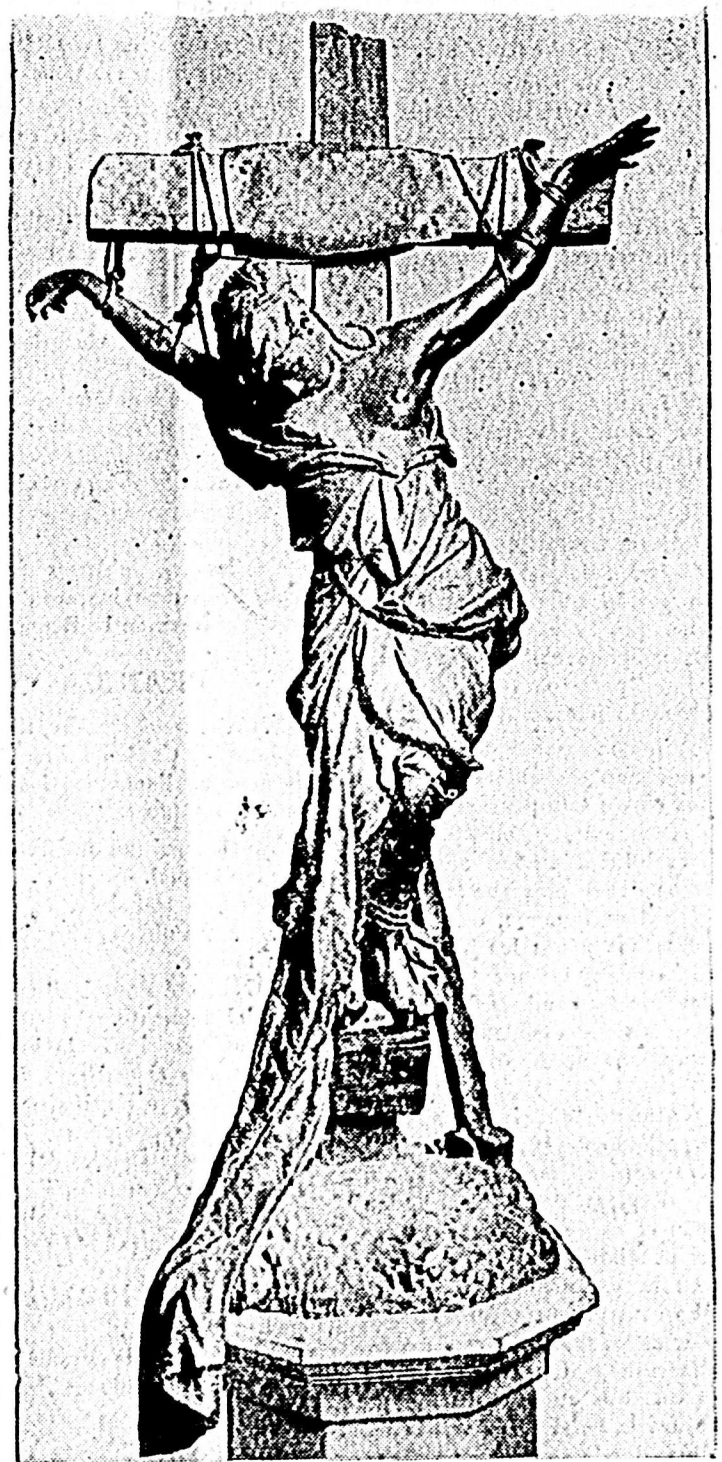
Célebre escultura de EMILIO FRANCESCHI