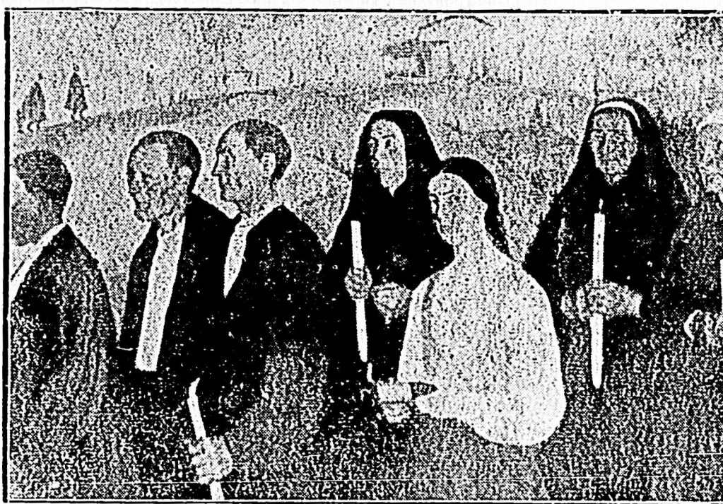
Cuadro de VALENTIN ZUBIAURRE