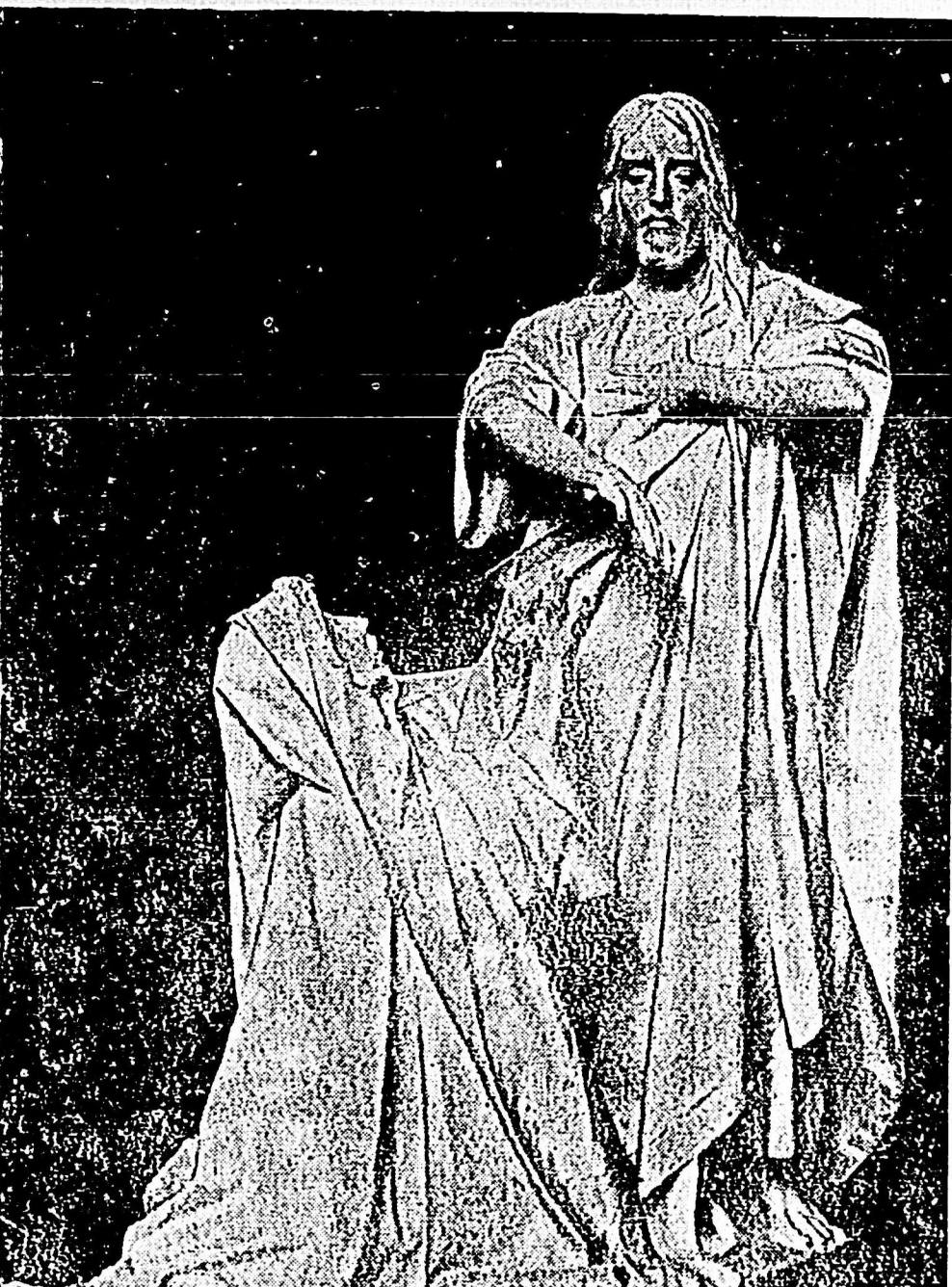
Grupo del escultor EZIO CECCARELLI