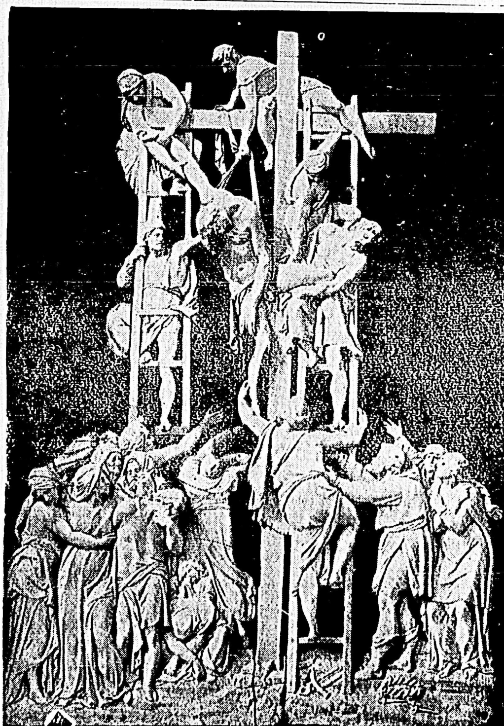
Célebre escultura de MIGUEL ANGEL BUONAROTTI