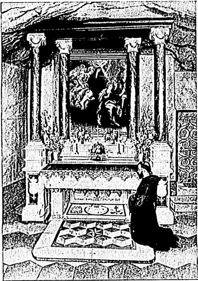
NAZARETH Gruta de la Anunciación