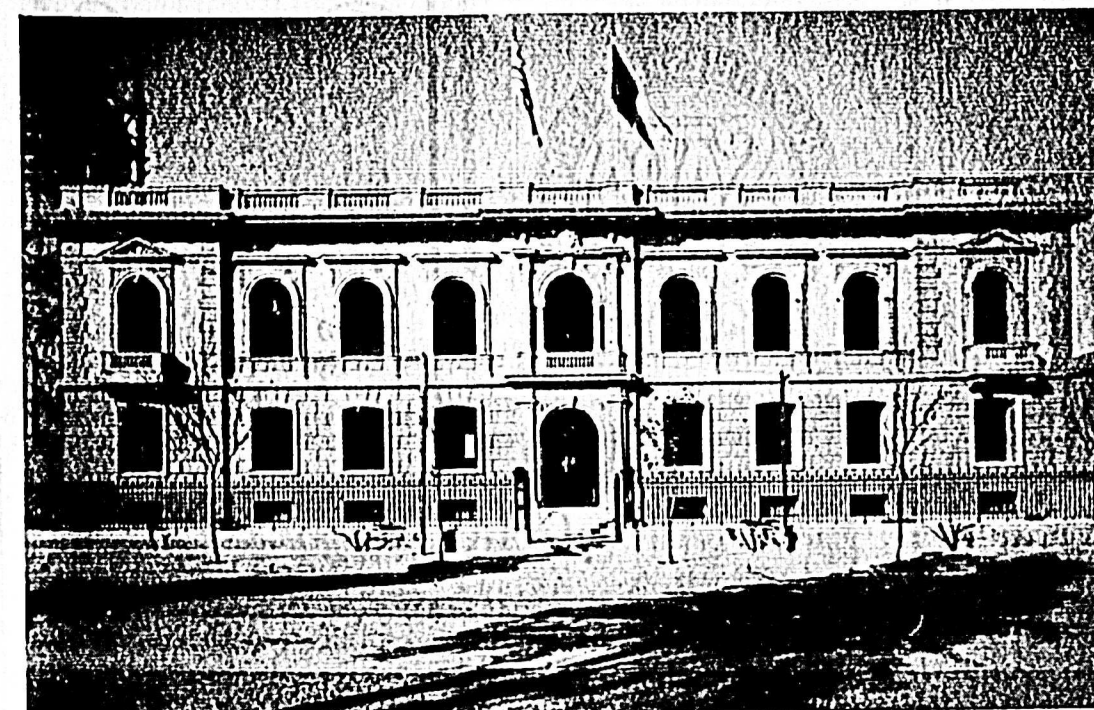
Exterior del Palacio Episcopal de Salto, levantado por su primer Obispo Diocesano, Monseñor DON TOMAS GREGORIO CAMACHO, de santa y perdurable memoria, donde fueron velados sus restos

En materia gráfica, nos sirven CAMPIGLIA y SOMMASCHINI, que tienen sus acreditados talleres de grabados, en San José 1118, Teléfono 8-69-65. — Montevideo.