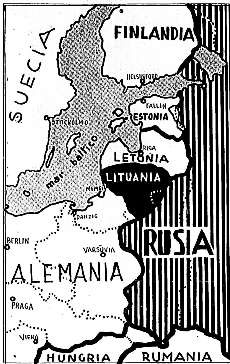
LAS CONQUISTAS RUSAS EN EL BALTICO

— Fueron presentados 45 proyectos en la Conferencia Americana.