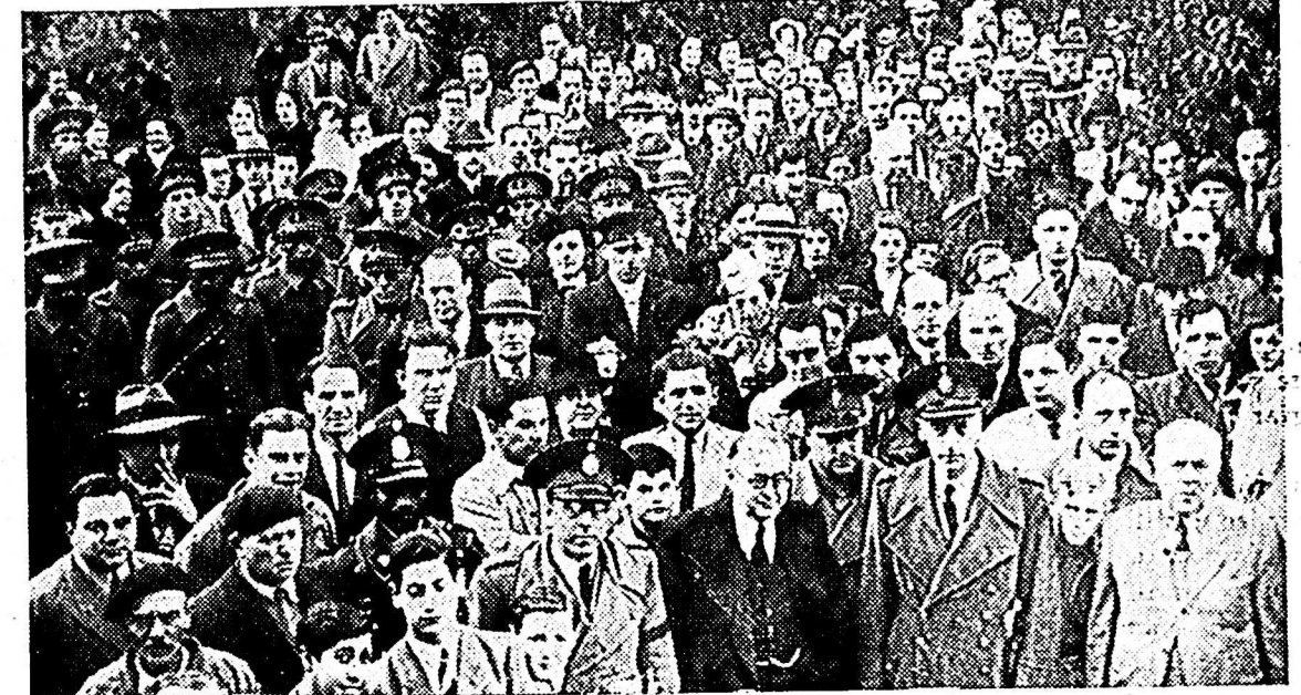
AL INICIARSE EL REPARTO AL PUBLICO EN GENERAL

Ya se han constituido y comenza- do sus actividades las Comisiones en- cargadas de organizar la segunda Movilización de la Juventud Cató- lica Uruguaya, que se realizará, Dios tes.