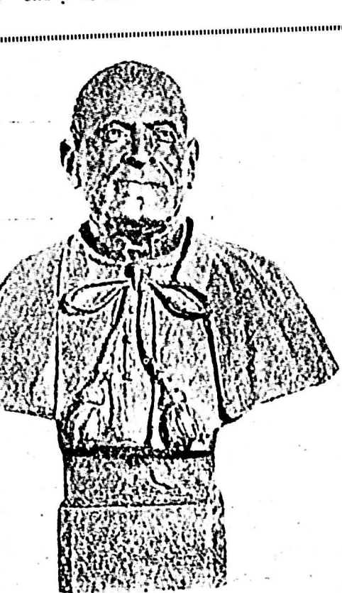
LA GRATA IMAGEN DE