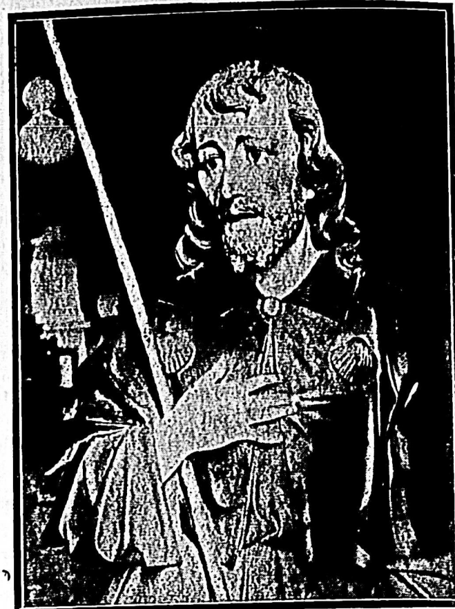
SAN ROQUE, cuya festividad se celebra con verdadero fervor