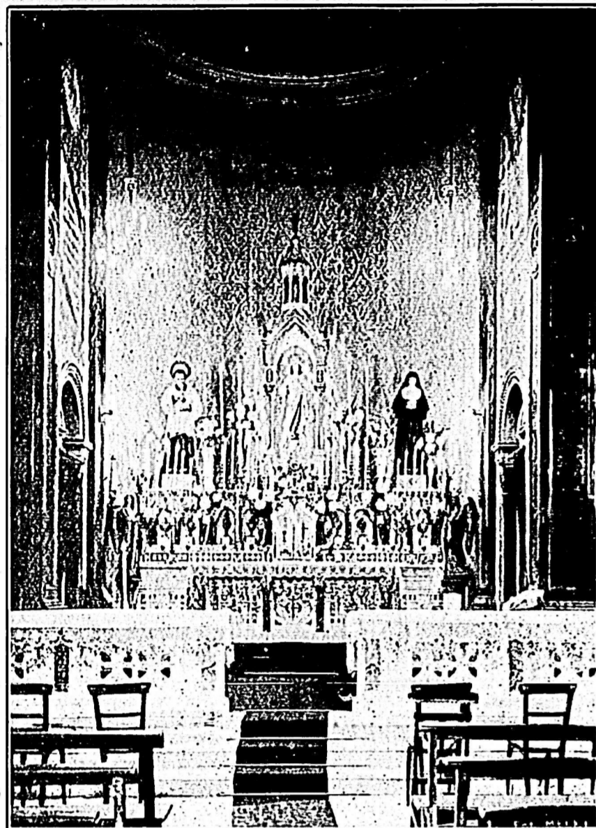
Altar Mayor de la Capilla de la Capilla Mayor de San Juan Bosco, dedicada a María Auxiliadora, con las estatuas de San Juan Bosco y de la Beata Mazzarello