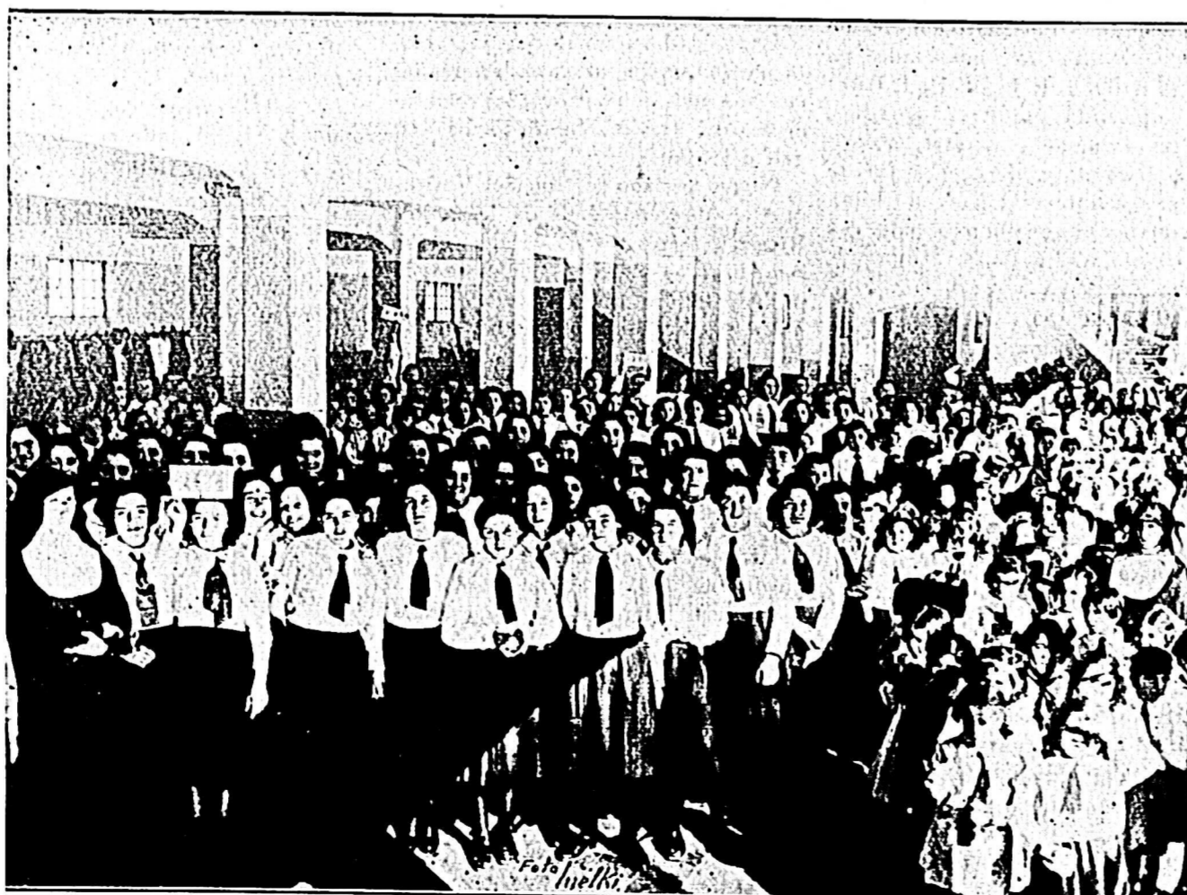
Las alumnas del Liceo y Escuela Taller María Auxiliadora, celebrando la fiesta de la Beata María P. Mazzarello