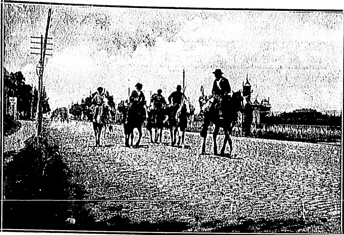
EN EL AÑO 1900, LOS LECHEROS ENTRABAN ANIMOSOS EN LA CIUDAD, Y PACIENTEMENTE REALIZABAN SU LABOR VISITANDO TANTOS HOGARES...