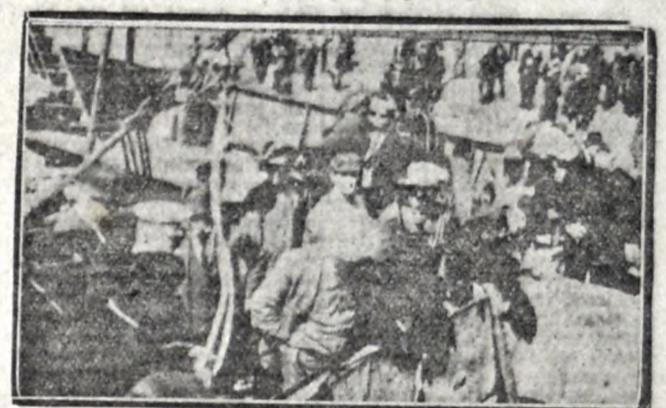
En el momento de inundar las bodegas

sión de técnicos se trasladara a bor- do a fin de constatar las afirmacio- nes del capitán.