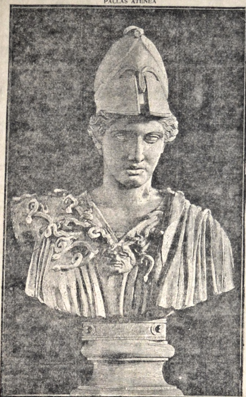
La diosa de los ojos claros

"El mundo no se salvará más que volviendo a ti, repudiando sus reyes bárbaros. Corremos, venimos en tropel. ¡Qué hermoso día aquel en que todas