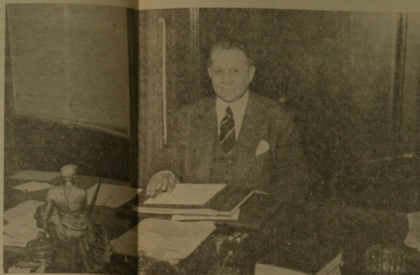
Sr. Lisandro Cersósimo dirigiéndose a nuestro periodista

Un miembro de esta redacción realizó una entrevista con el Sr. Lisandro Cersósimo, con motivo de su designación para la Cartera de Salud Pública y la que llevara a término, interesado en obtener para nuestro periódico algunas aclaraciones del nuevo Ministro, relacionadas con el momento político que vivimos y con las directivas de su gestión al frente de tan importante organismo del Estado.