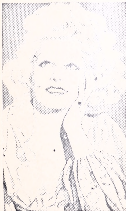
Jean Harlow in "Born To Be Kissed"