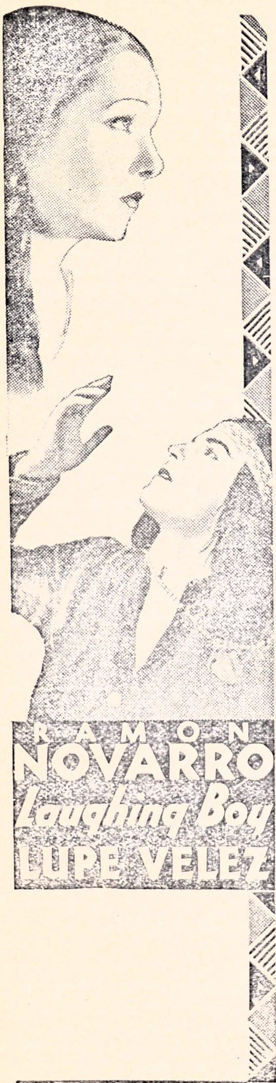
RAMÓN NOVARRO Laughing Boy LUPE VELEZ

Tendremos cantos y música de una raza bravia, áspera y fuerte.