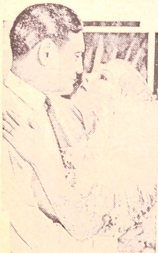
RICHARD DIX and MADGE EVANS in "DAY OF RECKONING"

Esta función, se efectuar el día 23 del corriente.