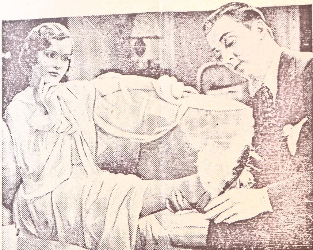
LEE TRACY and MADGE EVANS in "THE NUISANCE"

"A Caza de Emociones" es un film de raro argumento, Metro Goldwyn que será ofrecido en breve a nuestro público en el París